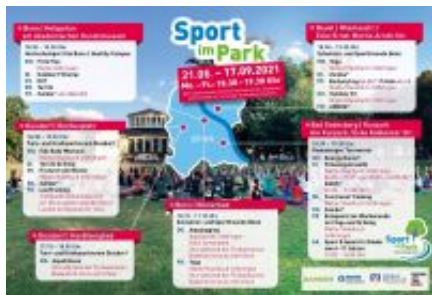
Angebote Sport im Park

Seit vielen Jahren beteiligen die SSF Bonn sich mit verschiedenen Sportangeboten an der Aktion „Sport im Park“ des Stadtsporbundes Bonn.