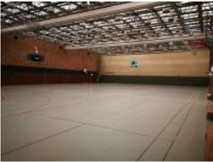
Dreifachhalle im Sportpark Nord

Über das Wochenende haben wir von der Stadt Bonn die Nachricht erhalten, dass ab dem 20.06.2021 die Inzidenzstufe 1 der CoronaschutzVO NRW in Kraft tritt. Da seit dem 11.06.2021 bereits die Inzidenzstufe 1 im NRW-Landesdurchschnitt in Kraft getreten ist, gilt für Bonn somit ab Sonntag die „Doppelinzidenzstufe 1“.