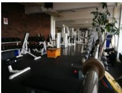
Fitness-Studio im Sportpark Nord