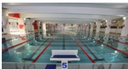
Schwimmbad im Sportpark Nord